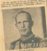
Ο Βασιλεύς Γεώργιος Β΄

Τό πρώτον ανακοινωθέν του Έλληνικού Έπιτελείου Πρωϊνοί συναγερμοί εις τας Αθήνας Ο Βασιλεύς εις τας όδοις της πρωτευούσης Τό Έθνος σύσσωμον αντιμετώπιζει τήν θρασύδειλον πρόκλησιν τών Ιταλών