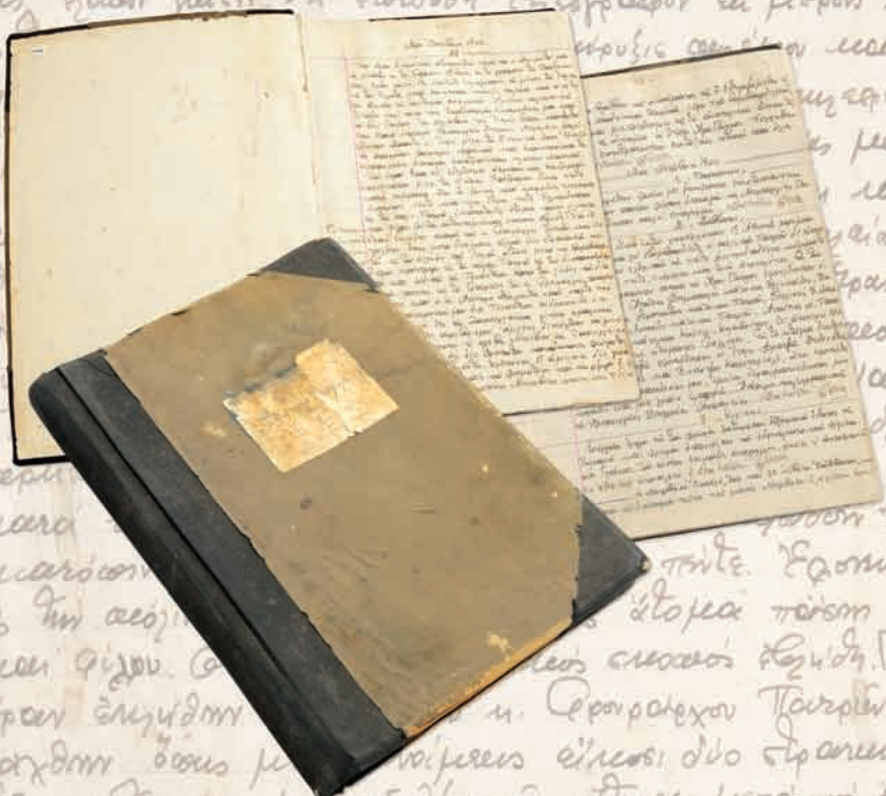
Το ημερολόγιο του υποδιοικητῆ χωροφυλακῆς μοίραρχου Εὐάγγελου Θέμελη, το ὁποῖο ξεκινᾶ τὴν πρώτη ἡμέρα τοῦ πολέμου «Μην Οκτώβριος 1940, 28 Δευτέρα» καὶ γιὰ ἓναν χρόνο καταγράφει τὴν πραγματικότητα τοῦ πολέμου καὶ τῆς γερμανικῆς κατοχῆς στὴν περιοχή τῶν Πατρῶν

Περι ἔργων ἡ πρῶτῃν ἀδοξασιᾶν περὶ τοῦ ἡ. Θεομισθίου καὶ μετὰ αὐτὸς εἰς τὸ Γρασεῖον. Φοδὸς αἰς τὸ Γρασεῖον τῆς Ἰασοῦ αὐτῶν ἔχουσιν κείνῃ ἐν ἐκείνῃ τῶν ἐργασίων εἰς μέτρον τῆς