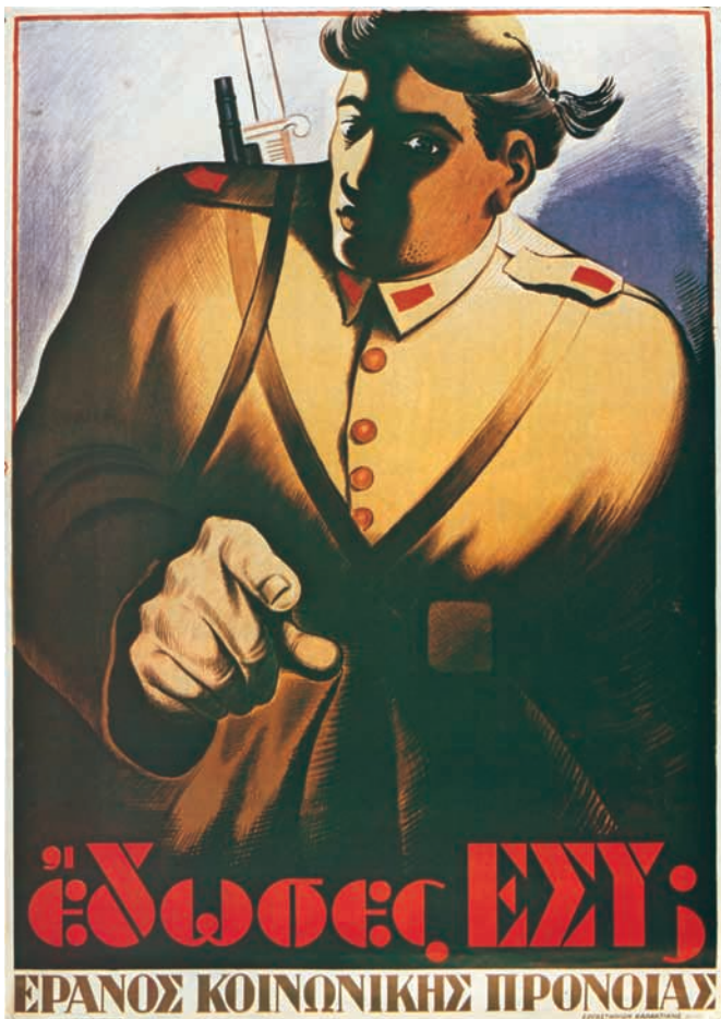
Προπαγανδηστική αφίσα για τον «Έρανο της Κοινωνικής Πρόνοιας», 1940 - 1941